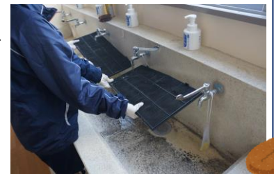
フィルター清掃の様子

企画して頂きましたPTAの皆様、ご参加頂きました保護者の皆様、学校美化へのご協力本当にありがとうございました！