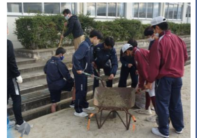
側溝の砂上げの様子